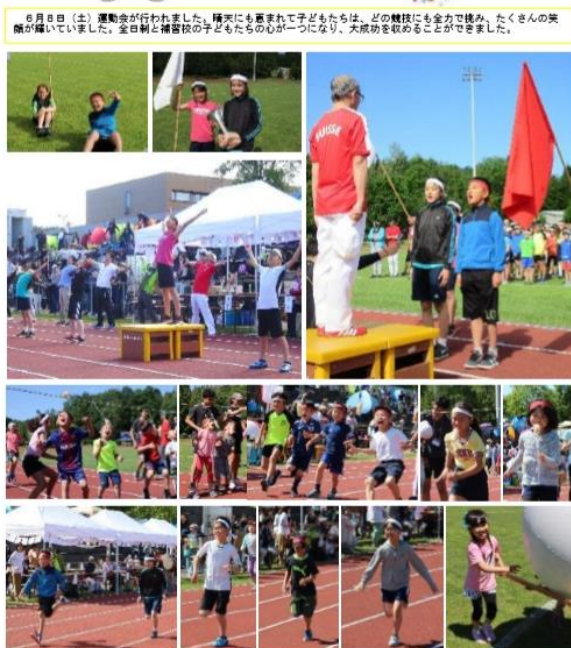
6月8日（土）運動会が行われました。晴天にも恵まれて子どもたちは、どの競技にも全力で取り組み、たくさん笑顔が輝いていました。全日校と補習校の子どもたちの心が一つになり、大成功を収めることができました。