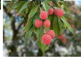
マンゴーとライチ。