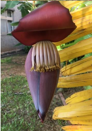
バナナの花を初めて見ました。