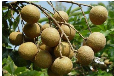
龍眼。ライチのような実で、甘くて美味しいです。