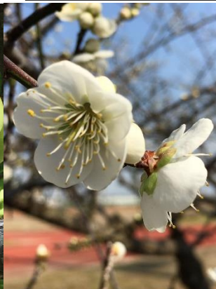
梅の花は台湾の国花でもあります。