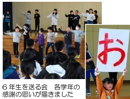
6年生を送る会 各学年の感謝の思いが届きました