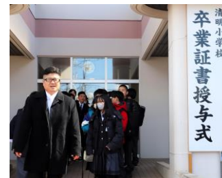
堂々と巣立っていった6年生