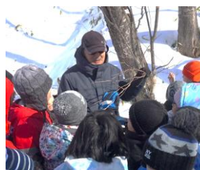
新庄先生の自然学習 池公園は生きた博物館