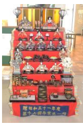
ぐりぐらの会の皆さんが設置した飾り