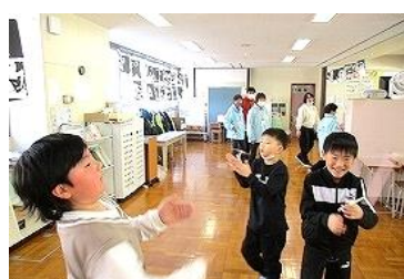
【2年生】牛乳パックなど、身近な材料で紙トンボ作り。説明を聞いて作った後は、楽しく飛ばして遊んでいました。