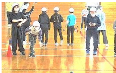
【3年生】ポッチャは、最初に転がした白玉に、自分の玉を如何に近づけるかを競います。指先まで集中して玉を転がします。