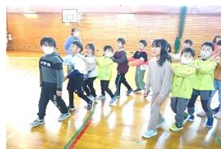
新1年生と現1年生でじゃんけん列車で交流。異学年の触れ合いも他者配慮を知る大切な学びです。