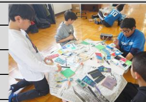
卒業記念作品を作る6年生