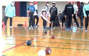
【4年生】4年生になると、戦略性もアップ。作戦を立て、白玉に狙いを定める眼は真剣そのもの！！