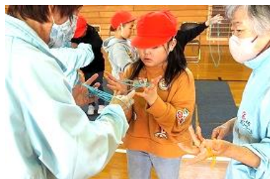
【1年生】たくさんの昔遊びを教えてくださいました。「あやとり」では地域の方の指の動きを注意深く見つめて真似をしていました。集中カパワーアップ↑↑。

各授業には、社会福祉協議会の方も参加して下さっていました。清明小校区には、子ども達を見守って下さっている方がたくさんいます。一緒に活動する時間は限られますが、地域の方のあたたかさを感じながら学校生活を送ってほしいと思います。