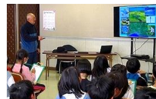
3年生は視聴覚室で。真剣に話を聞き、たくさんメモを取っていました。