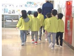
学校の中を探検しました。目新しく映るもの数々に興味津々。

入学後には交流の多くなる学年です。4月から仲良く過ごし、清明小の『元気』を支えてほしいなあと思っています^^。