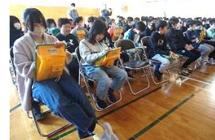
4・5年生はメモの質もさすが。内容はお礼の手紙にばっちり反映されていました。