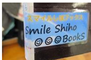
寄贈された本にはこちらのマークが。優しさと強さを秘めた笑顔に、清明小の児童が見守られているかのようです。