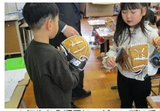
1年生から順番に、グローブに手を通しました。『世界』を感じる窓口になるかもしれません。