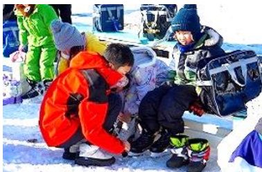
6年生の靴はかせサポートによりスムーズに練習開始。今では1年生も自分ではけるようになりました。急成長！！

今週はスケート参観週間となっております。そんな子ども達の姿をご覧いただければ幸いです。