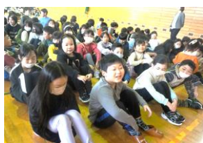
一人も無駄話せず、真剣に校長先生の話を聞く子供たち。

■ 三つ目は「命を守る学習を真剣にすること」です。日本航空機が衝突事故で炎上しましたが、乗員乗客が全員無事でした。避難訓練を真剣に実施していたからだと言われています。学校もいつ何があるかわかりません。避難訓練もあるので命を守るために真剣に学習し、ケガや事故のないように安全に注意して生活してくださいとお願いしました。