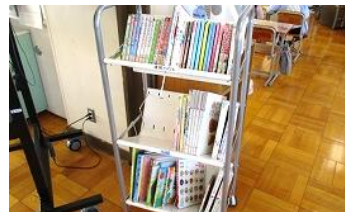
学習状況や年齢を考慮して各学年棟に図書を配置しました。少しでも多くの児童により多くの本を手にとってほしいです。

〇〇〇〇先生が教職の中で使用していたたくさんの図書を、ご家族が清明小へ寄贈くださいました。中には児童向けの図書も多く、冬休み中に整理をして各学年棟に配架することとしました（PTA 整備移動式本棚活用）。先生の思いはこれからも図書を通して清明小の中に息づいていきます。