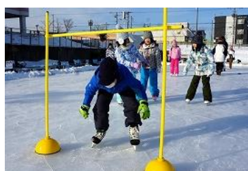
ゲートをくぐるために、姿勢を低くし、ひざや足首の曲げ伸ばしを意識します。