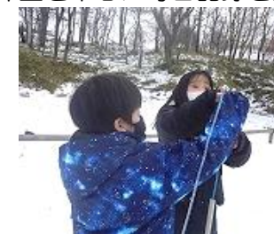
装置が示す深度を測ります。その他に気温や降雪量なども記録しています。

調査を通して、科学的なものの見方を身に付けると共に、池公園を窓口知識や関心が世界に向けて広がることが期待しています。