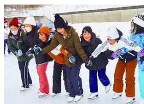
手をつないで滑る6年生