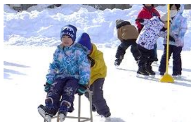
イスを押す足運びは、力強いスケートिंगにつながります。リレーなどを通して楽しく学んでいます。