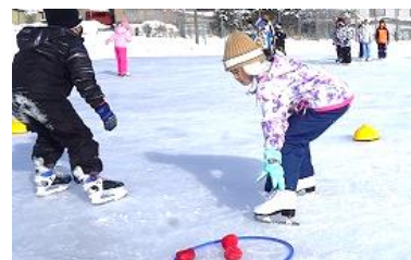
紅白玉を移動させるリレーをしています。こちらも低い姿勢やターン、ストップといった技能の習得につながります。