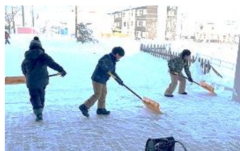
ちょっぴり早めに登校した児童が協力して除雪。人数がいて作業はかどること以上に、進んで働く姿がうれしいです。

ちなみにスケートリンクに深く降り積もった湿った雪をすぐに取り除くのは、大人にも『できないこと』でした。ここは、地域の吉田造園様のお力を借り、翌日からはスケートの授業を行うことができました。ありがとうございます。