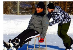
椅子押しリレー (5年生)