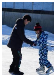
6年生に手を引かれて滑る1年

■ 12月下旬より作成してきたスケートリンクも無事に完成し、3学期はほぼ毎日スケート学習を楽しんでいます。リンク造成、毎日の散水、そして除雪と、リンクの維持・管理は大変です。そんな苦勞を吹き飛ばしてくれるのが子供たちの成長する姿です。どの学年も工夫ある楽しい学習によって子供たちがメキメキと上達しています。楽しそうに歓声を上げて滑る姿に教育の素晴らしさを感じます。今年も子供の成長する姿を追い求めて努力して参ります。