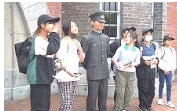
ろう人形と記念撮影。館内あちこちにリアルなろう人形があり、道東の歴史を感じることができました。