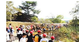
池公園もトンボ池も湿原に似た生態系とのこと。深い学びになります。