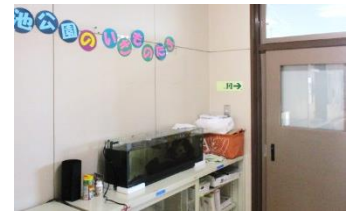
広い水槽ですが、スイレンの根のもとに集まって過ごすヤチウグイ達。安心できる場所のようです。