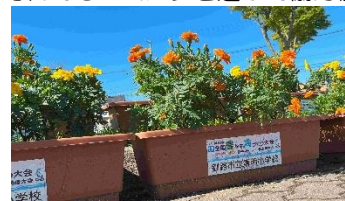
黄と橙のマリーゴールドが、児童玄関前で風に揺れています。

多くの方の思いがこもったプランターの花達は、大会で役目を終え、現在は清明小に戻り、毎日子ども達を見守り続けています。