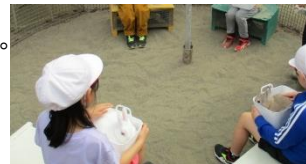
モルモットとのふれあいです。手のひらに伝わる温もりで命を感じられますね。

4年生は、春採湖畔のトンボ池へ行ってきました。池公園との比較をするなど、学習が一層深まったようです。また、博物館を見学し、湿原や昔の人の暮らしについて説明を受けました。