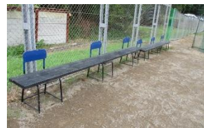
体育の時間や休み時間の休憩場所になっています。