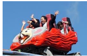
北見ファミリーランドでの活動。マナーを守っての遊具利用の学習です。青空に歓声と悲鳴が響いていました。