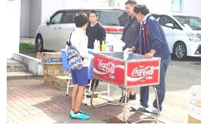
玄関前では、スーパーボールすくいにジュース渡し、焼き鳥販売。晴天のもと、たくさんの人でにぎわっていました。

また、体育館では「えがおのまちプロジェクト」の皆さんにもブースを構えて頂きました。どうもありがとうございました。