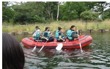
屈斜路湖をボートで遊覧。生き物の観察等を交えながら楽しく体験活動を行いました。

いつもの仲間と、いつもと違う2日間を過ごしたことで、集団行動の責任感や他者への気遣いなど、教室とは一味違う学びを得て、心が豊かに成長したことと思います。成長した心と深まった絆。担任からも成果が試されるのはこれからとの激励がありました。小学校生活最後の1年もちょうど折り返し。パワーアップした姿で清明小学校をますます輝かせてくれることを期待しています。