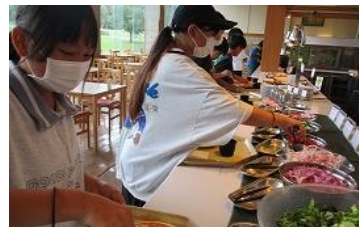
体を動かした後は、ハイキングで昼食。みんな、もりもり食べていました。