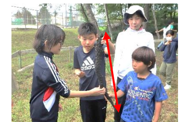
池にたくさん生息しているスライムの根の長さびっくり！植物も周りから見えない水の中で頑張っているんですね！

近くにある「池」ですが、未知の部分がたくさん見つかっています。今後の学習の発展が楽しみです。