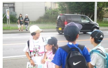
厚岸の街並みの名スポットを探して写真を撮るフォトラリー。地図を見ながらグループで町を探検しました。

日常生活よりやる気がアップした状態で、5年生の子ども達はいつもより積極的に活動し、優しく友達と関わっていました。学校とは違う場で様々な体験を通して、多くを学び、心もぐっと成長したことでしょう。成果が試されるのはこれから。学校生活の中でパワーアップした5年生の姿が見られるのが楽しみです。