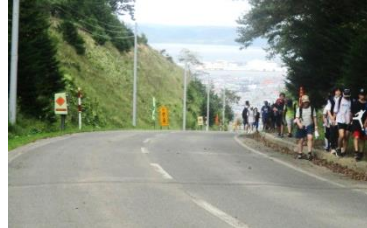
ラリー後は、ネイバル厚岸までの坂を登る登る。振り返ると街並みと海。素敵な景色が疲れを癒してくれます。