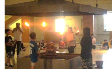
火を囲んでのフォークダンス。声を張り上げて元気に踊りました。