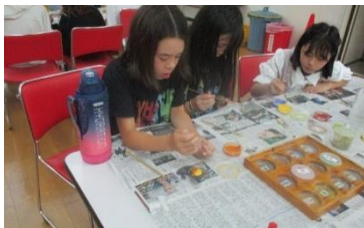
七宝焼きにチャレンジ。絵の具を塗った銅板を焼き、素敵な作品ができました。