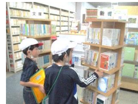
小学校とは広さも冊数も違い、圧倒されたでしょうか。

どちらの学年も、始業式で校長先生がお話していた「あいさつ」「返事」をしっかり行い、学習してきました。