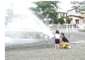
消防署での放水体験。水圧の強さにびっくり！