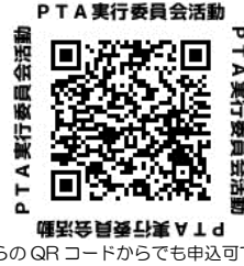
※こちらのQRコードからでも申込可です。