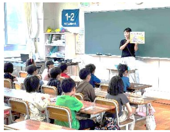
1年生は身を乗り出して、絵やお話の展開に夢中になっています。