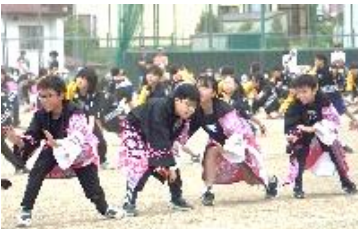
最高学年の動きは迫力がありました。背中を下級生を引っ張りました。