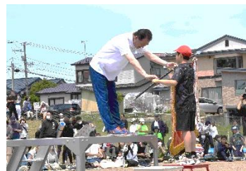
勝負事なので勝敗はつきます。ですが、練習期間も含めて真剣に全力で取り組んだ皆が「勝ち」ですね！

運動会当日はあたたかい応援に加え、会場マナーの遵守ありがとうございました。暑い中での応援となり、保護者の皆様にとっても体力的に厳しかったことと思います。また、運動会後に片付けと撤収が速やかに進む様子を見て、保護者の皆様のご理解ご協力を改めて心強く感じました。大人として「範」を示してくださったことに、空も快晴で応えてくれたのかもかもしれません。