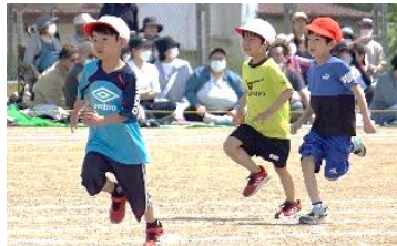
小学校運動会デビューの1年生。話を聞く態度、真剣に取り組む姿勢が成長しました。

子ども達の躍動する姿、引き締まった表情、そして充実と安堵を感じさせる笑顔からは、「これまでの練習期間のがんばりや成果を発揮した！」「多くの人に見てもらえた！」という確かな『感動』が感じられました。そして、決められたことをこなすだけでなく、主体的に練習し、本番に臨んだ分だけ、確かな成長を手にしたことでしょう。