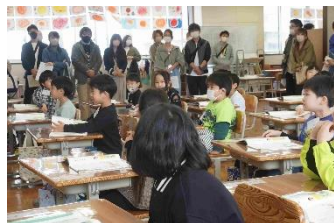
1年生はたくさんの参観者にドキドキ。初めての参観日。新しい環境の中で良い返事、良い姿勢でがんばっていました。

様々な機会を設けて家庭と学校とで子どもの姿を共有することで、清明小が目指す「子どもを主語にした」教育活動が前進していくものと考えております。共に子どもの成長を支えていけるよう今後ともご支援ご協力のほど、よろしくお願いいたします。