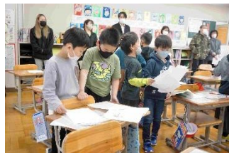
2年生は、作文を上手に書くためのメモ作り。学習の過程に対話を取り入れることで、深い学びを目指します。