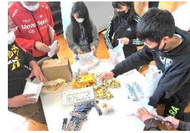
入学祝として様々な用品が届きます。それを仕分け、1年生の机に配り、もれがないかチェックする…。大切な仕事です。