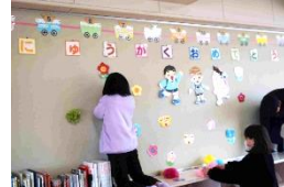
1年生の教室を華やかに装飾してくれたのも6年生です。「1年生のために」という明確な相手意識が素敵です。