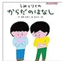
(著者)遠見才希子さん 童心社 出版