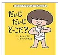
(著者)遠見才希子さん 大泉書店 出版