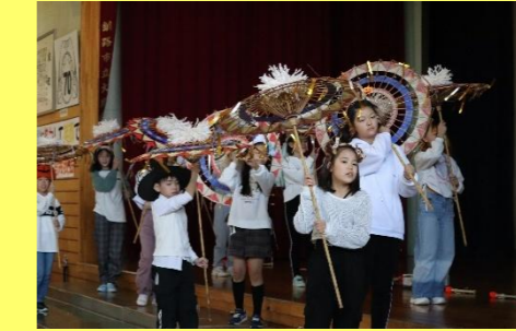
4年生は鳥取傘踊りなどで日本の素敵を紹介しました。