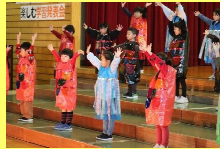
1年生は国語科で学習した「スイミー」を中心に発表しました。

11月16日(土)は学習発表会でした。今年度から「学芸会」ではなく日常の学習の成果を十分に発揮する場にしよう、という主旨のもと「学習発表会」と名称を改めました。どの学年も笑顔輝く素敵な発表となりました。観覧して下さった保護者、地域の皆様本当にありがとうございました。