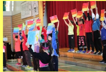
3年生は「にじ」という歌やダンスをカッコよく披露しました。