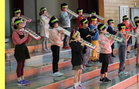
2年生は春夏秋冬を詩の朗読などで表現しました。