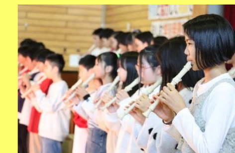
6年生は最後の発表。6年生らしい素敵な合奏、合唱で楽しませました。