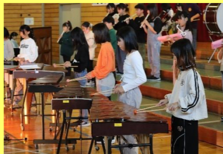
5年生は「威風堂々」の器楽演奏や跳び箱などを発表しました。