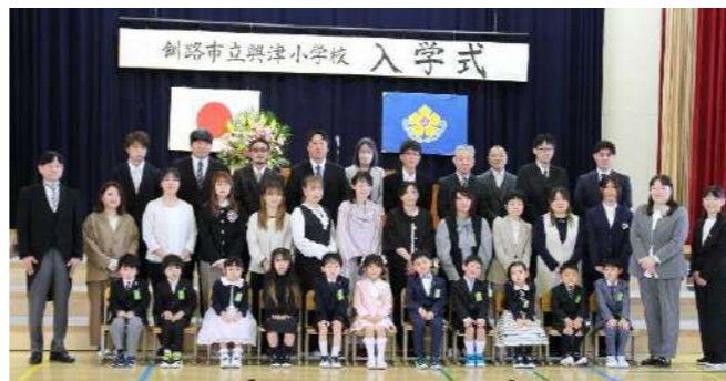
1年生11名が興津小学校に入学しました