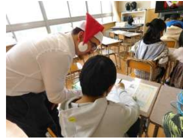
10/28 ワールドフェスタ(3~6年)