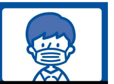
マスクをつけよう