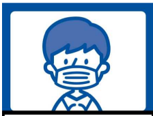
マスクをつけよう