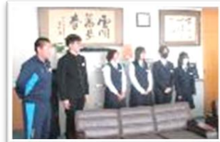
今年度で活動を終える柔道部員6人と顧問の先生が、校長室に終了報告に来ました。「校長先生や、色々な人の支えのおかげで、ここまでやり切ることができました。」と涙ぐみながら挨拶してくれました。よく頑張りました!